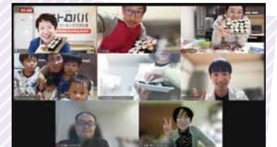
美味しくできました！

最小限の包丁と火を使い、短時間で作れる簡単レシピを求める医療従事者にぴったりのメニューを教えてくださいました。和の要素があり、特別感もある細巻き寿司は、食卓を華やかに彩ります。「作ったそばからなくなりました」「家族から翌日もリクエストされました」と、大好評でした。また、料理をしながら、参加者同士で男性の育児休業についても話題に触れました。「1か月の育休を取得して、産後の妻の、精神的、肉体的負担を軽減できた。子どもの新生児期に24時間寄り添える貴重な経験ができた。」「診療科にもよると思うが、当たり前になってきている。上司の理解も得られている。」と前向きな意見を聞くことができました。