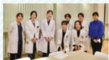
経験談をお話くださり温かいアドバイスや女性医師の皆さん

参加してくれた学生さんからは以下のような嬉しいお言葉や貴重なご意見をいただきました。 「自分が働きだした時に思い出したい言葉をたくさん聞けました」 「女性医師の生の声を聞いて貴重な経験となりました。ありがとうございました。」 「たくさんお話ができてとてもためになりました。どんな生き方をしても、どんな選択をしても、正解・不正解はなくて人と比べることなく、自分の価値観を大事にしたいなと思いました。」 「たくさんの女性の先生の話聞いて、リアルな子育てやキャリアについて考えることができました。将来、どの科にいても、どのタイミングでも周囲の環境に合わせて、自分なりの働きができそうだとわかり、自分の興味のあることを大事にしたいと思います。」 「女性医師の方のキャリアと家庭のバランスについての考え方や、実体験をお聞きできてよかったです。」 「自分の未来と向き合って考えるきっかけとなりました。実習でひと通りまわって就活の前に開催されることで、より身に沁みました。ちなみに同級生の男の子は、この会を羨ましがっていました。キャリアは男性、女性双方の協力や理解が必要だと思うので、男性陣にもサポートは必要だと思います。」